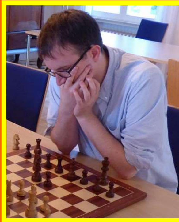
Klubmeister im Blitzschach 2017