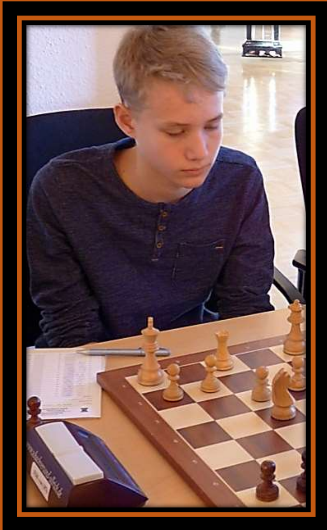
Asbjørn Schack Archivbild

Aus diesem Diagramm heraus können Sie leider wegen technischer Gründe die Fortsetzung nicht weiterspielen. Aber das gelingt sicher im Kopf!